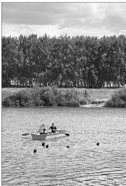
«Фәйзуллин йөзүләре» быел 45 нче мәртәбә Биектау районындагы Чулпан күлендә үттө.